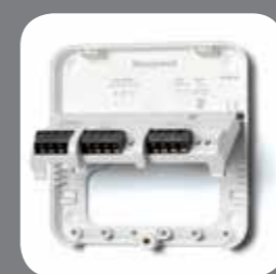
Placa de montaje del receptor